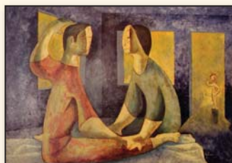
"משפחה" של חלסיו חימנס - GIMÉNEZ