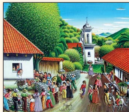
"קרב תרנגולים" של סליה - ZELAYA מהורם ה"נאיבי".

בתערוכה יוצגו כ-20 יצירות מתוך האוסף. האוסף שייך למשפחת מלצר אשר מעוניינת לחזק את הקשר בין שוחרי אמנות לבין אמני הונדורס. על אף שהונדורס נחשבת למדינה נחשלת, מיטב הציירים הגיעו ממנה. משפחת מלצר מעוניינת לשתף בקסם שביצירות של הציירים החשובים הללו.