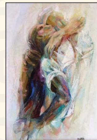
"סגנון" של הצייר MATUTE

קבלת פנים בקארו אמנויות מוצ"ש ה-2 למאי משעה 18:00 עד 21:00 התערוכה תוצג עד ה-31 למאי.