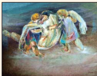
"נאב ותמימות" של מטוטה - MATUTE

בתערוכה יוצגו כ-20 יצירות מתוך האוסף. האוסף שייך למשפחת מלצר אשר מעוניינת לחזק את הקשר בין שוחרי אמנות לבין אמני הונדורס. על אף שהונדורס נחשבת למדינה נחשלת, מיטב הציירים הגיעו ממנה. משפחת מלצר מעוניינת לשתף בקסם שביצירות של הציירים החשובים הללו.